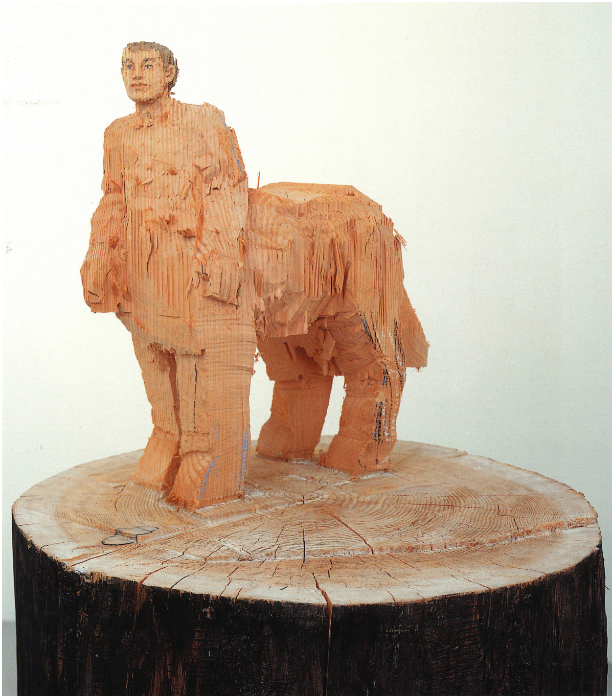
Stephan BALKENHOL (1957), Centaure , 2000, bois peint, 158,5 x 74 x 71 cm, Zurich, Mai 36 Galerie.