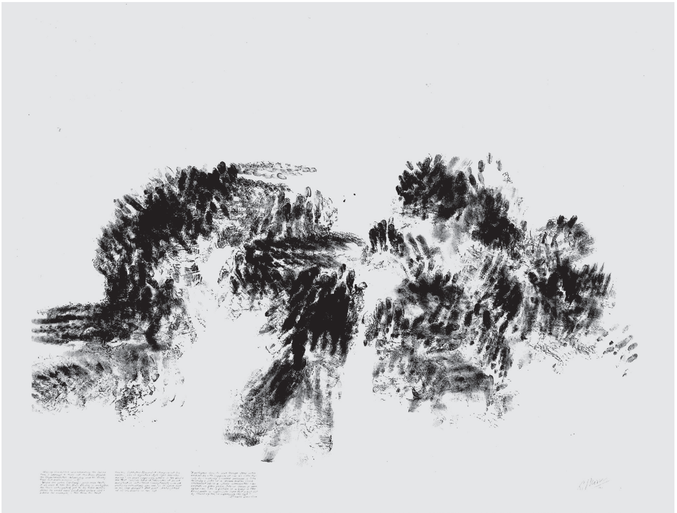
Robert MORRIS (1931), Blind Time IV (Drawing with Davidson) , [Temps aveugle IV (Dessin avec Davidson)], 1991, graphite, oxyde de fer, huile sur papier, 96 x 127 cm, Paris, Centre Pompidou.