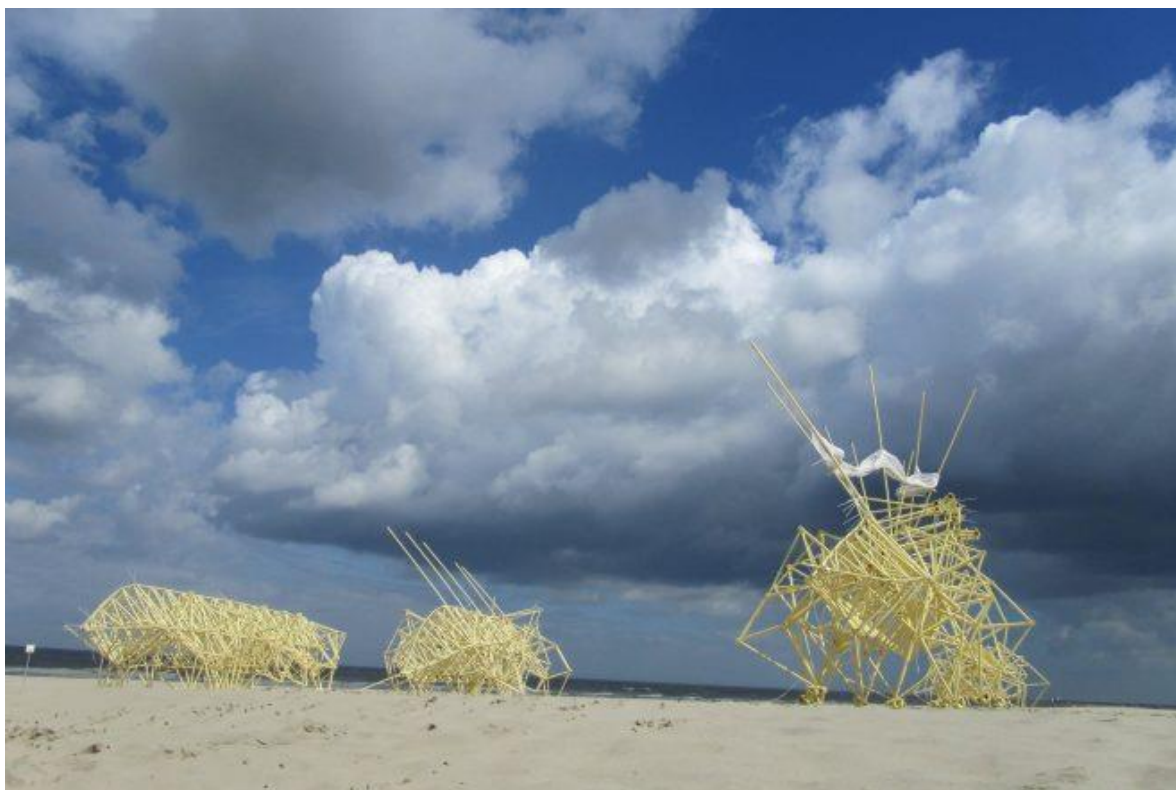
JANSEN Theo , artiste, Umerus Animaris Umerus (Silent beach), sculpture, 2009.