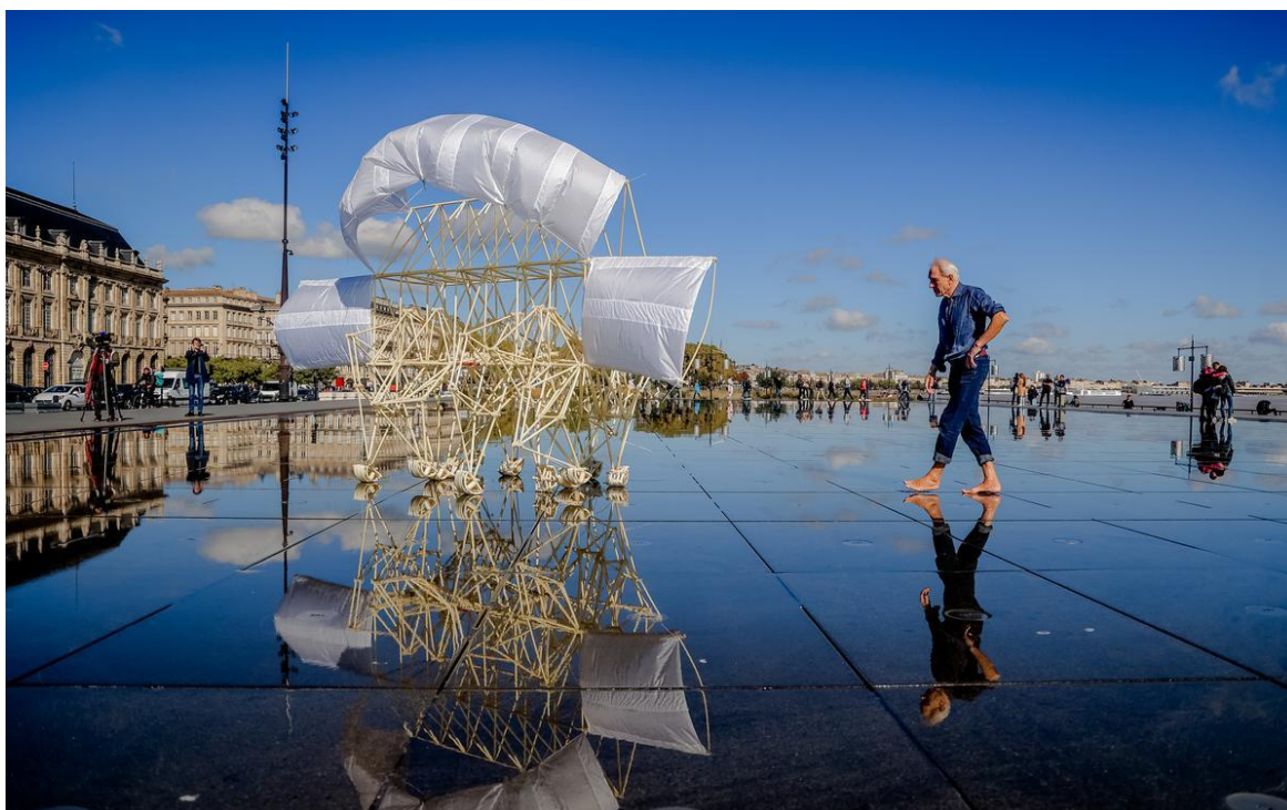
JANSEN Theo , artiste, Ordis , sculpture, exposition Strandbeests* . The New Generation sur le miroir d'eau de Bordeaux, vendredi 30 septembre 2022

*Strandbeets, traduction du néerlandais : animaux de plage