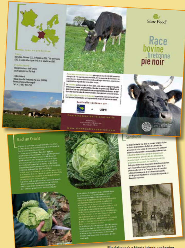
Plegfollenoù o kinnig intrudu gedourien Slow Food e Breizh betek-henn.

Evit gouzout hiroc'h : WWW.SLOWFOOD.FR WWW.CHOUELORIENT.ORG WWW.RESEAU-COHERENCE.ORG WWW.BRETONNEPIENOIR.COM