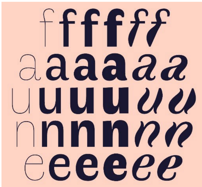
Vision d'ensemble des différents styles