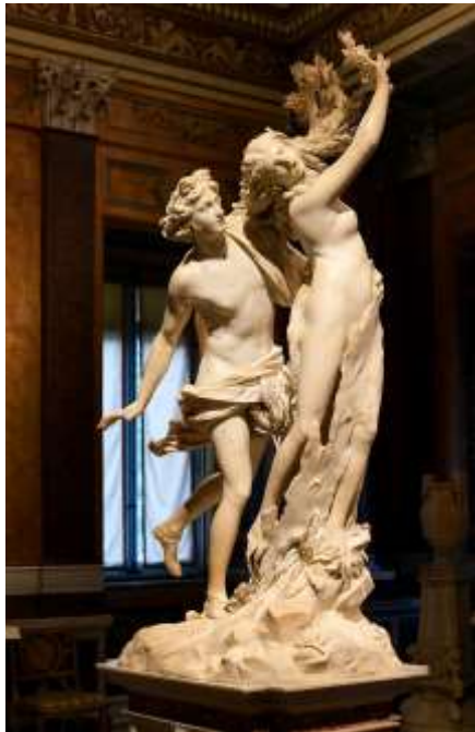
Gian Lorenzo Bernini, Apollo e Dafne , marmo, 243 cm, Galleria Borghese, Roma, 1623-1625.