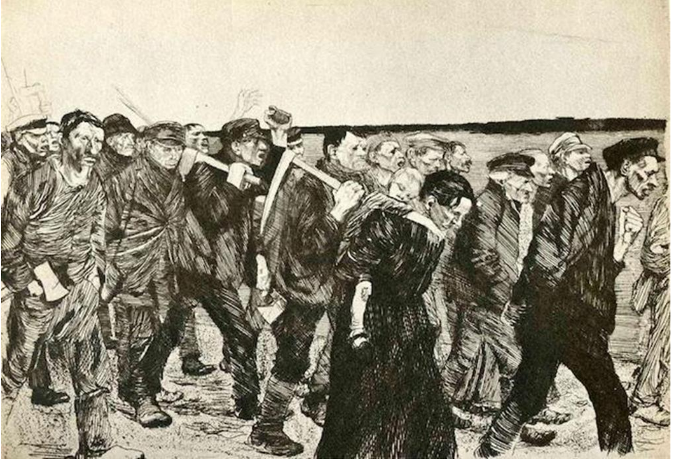
Käthe Kollwitz, Der Aufstand der schlesischen Weber 1844 (1897/1898)