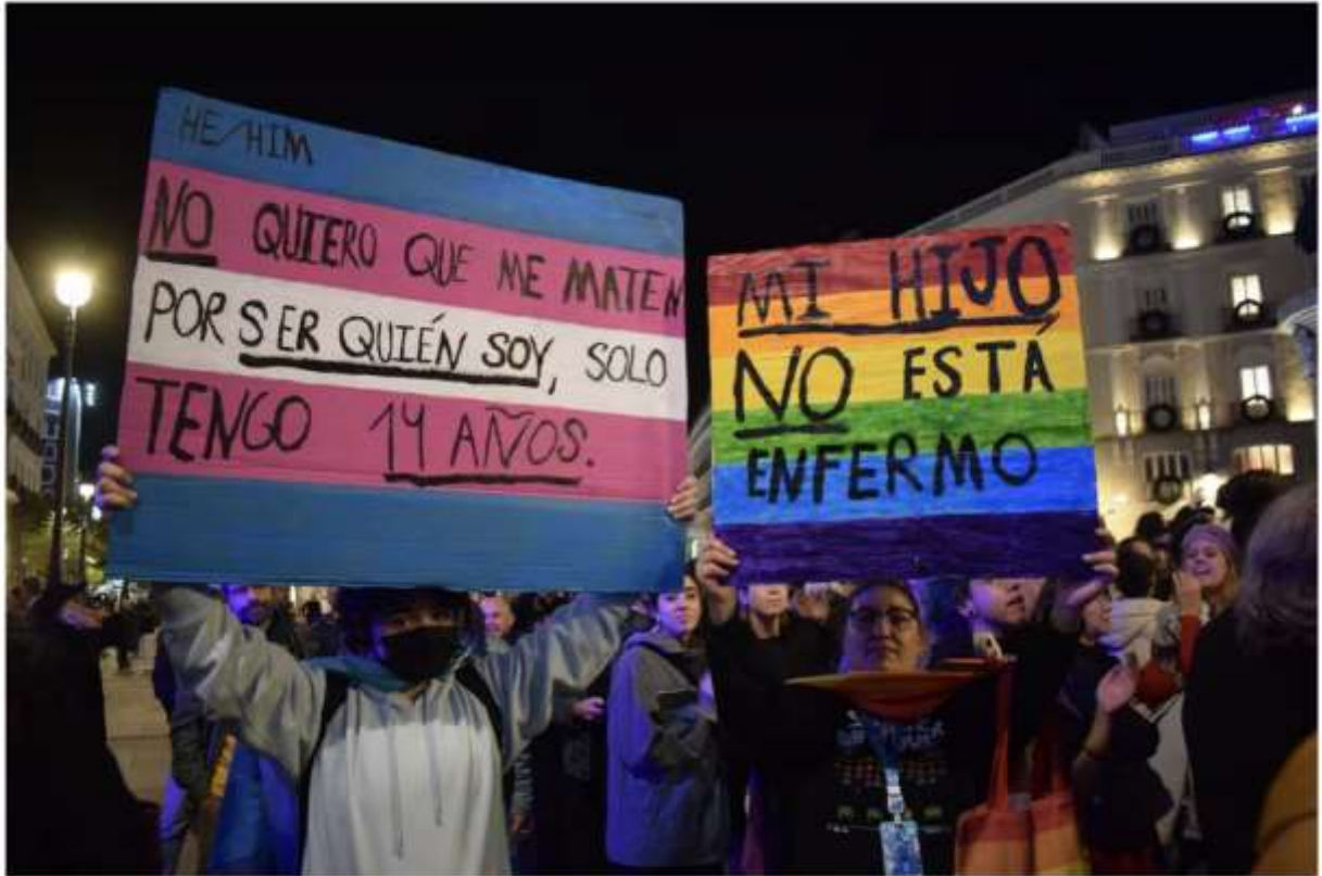
La plataforma "Ni un paso atrás" durante una protesta frente a la sede de la Comunidad de Madrid. ANA MARÍA PUENTES PULIDO