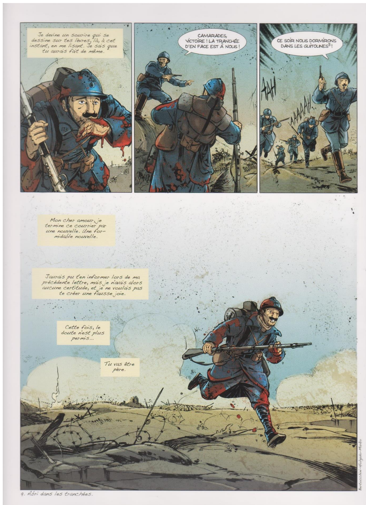
Strattu di : Bertocchini Frédéric, Marko, Holgado Iñaki è Sayago Nuria. (2014). Une formidable nouvelle. In Aiò zitelli ! Récits de guerre 14-18 (p. 27-33). Albiana - Musée de la Corse – Collectivité Territoriale de Corse.