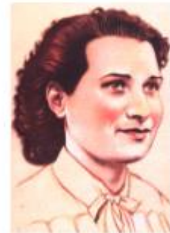
Danielle Casanova (1909-1943)