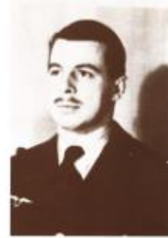
Fred Scamaroni (1914-1943)