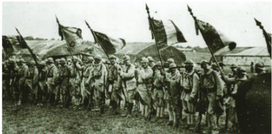
Duc. 2 I zitelli : suldati di u 173 ma rigimentu d'infanteria, cumpostu di Corsi.

Passatu in rivista u 29 di settembre di u 1917 da u marisciallu Pétain, u rigimentu hè dicuratu par via di u so curagiu. I suldati ricevenu una « fourragère » di listessu culore cà a croce di guerra. 3451 omi d'issu rigimentu funu tombi trà 1914 è 1918.