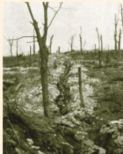
Duc. 4 Trincea di u boscu di la Caillete, Verdun, aprile 1916, dopu trè ghjorni filati di battaglia.