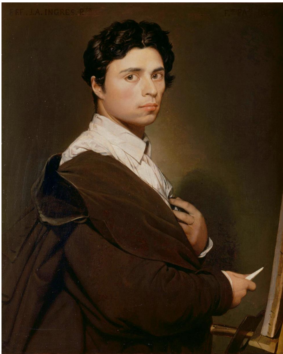
Jean-Auguste-Dominique Ingres (1780-1867), Autoportrait à vingt-quatre ans , 1804. Huile sur toile, 78 x 71 cm Chantilly, Musée Condé (Château de Chantilly)