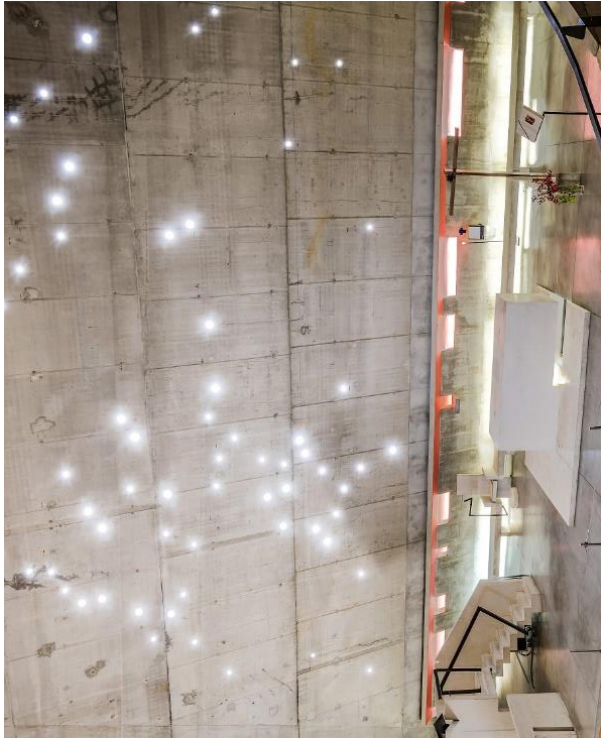
Le CORBUSIER, Charles-Édouard JEANNERET-GRIS, dit (1887-1965), Église Saint Pierre, Constellation d'Orion , lumière naturelle traversant l'architecture, 1973-2006. Firminy.