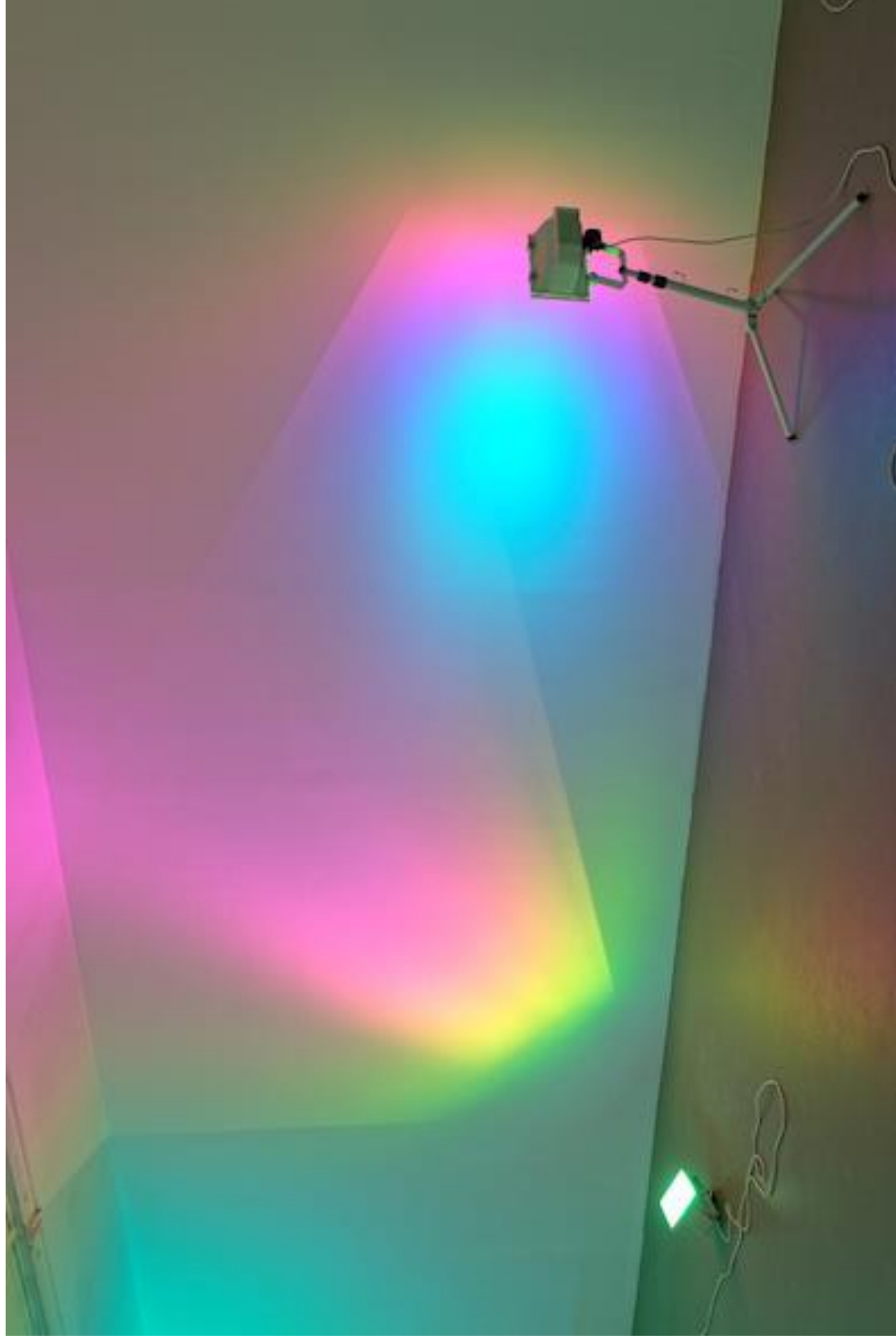
Ann Veronica JANSSENS (1956-), Hot Pink Turquoise , 2019, 2 lampes halogène 750/1000 watt, filtre dichroïque couleur, 1 tripode, dimensions variables. Paris, musée de l'Orangerie.