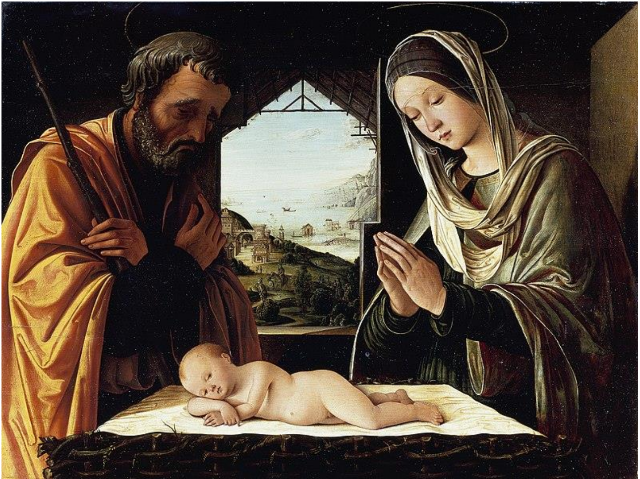
Lorenzo COSTA (1460-1535), La sainte Famille , vers 1490, huile sur bois, 65 x 85,5 cm. Lyon, Musée des Beaux-Arts.