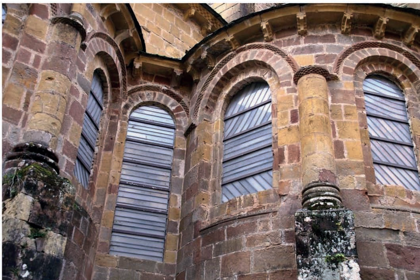
Vue extérieure du chevet de l'église