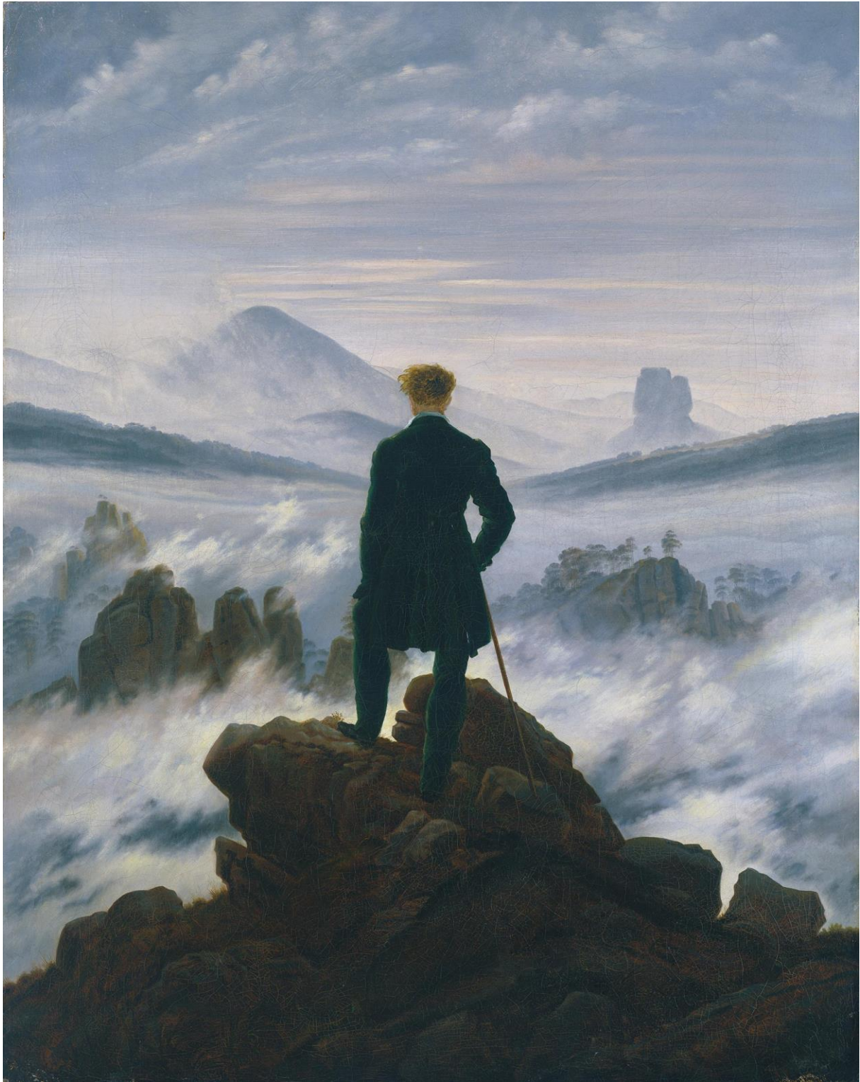
Caspar David Friedrich, Wanderer über dem Nebelmeer , 1819