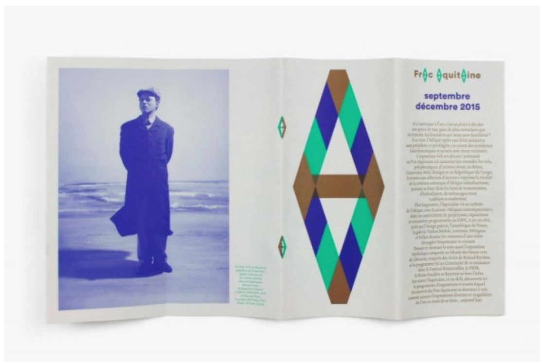
2. Fanette Mellier, graphiste, livret de présentation du trimestre, FRAC Aquitaine, 2015.