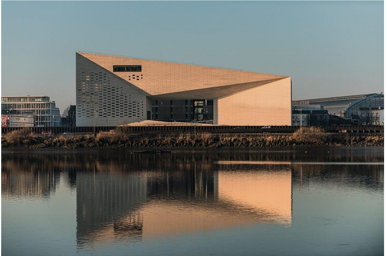
1.a. Bjarke Ingels , architecte, Maison de l'Économie Créative et de la Culture (MECA), intégrant le FRAC (Fond Régional d'Art Contemporain) Aquitaine, Bordeaux, 2018.