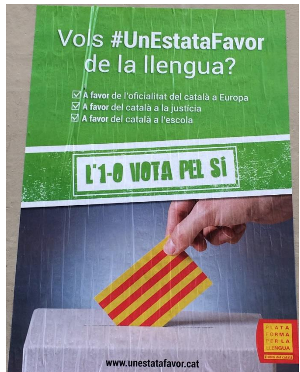
¿Quieres #UnEstadofavor de la lengua?