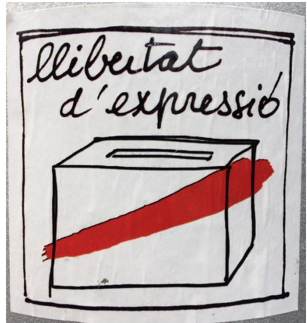
Libertad de expresión