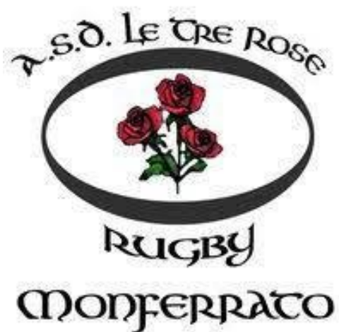
Logo de Squadrasportivarugby .