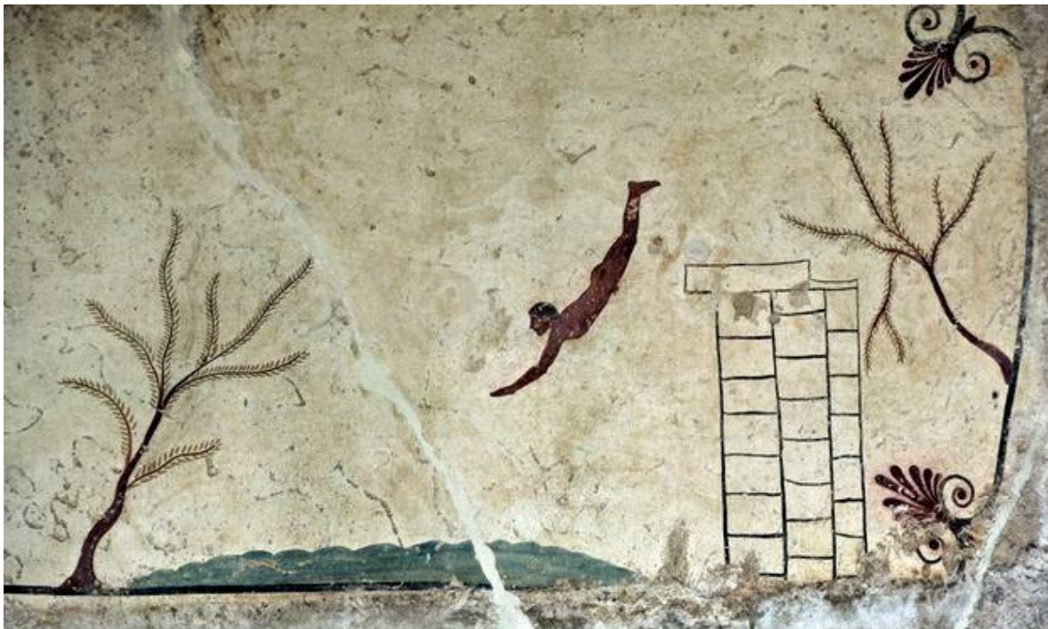
Autore sconosciuto, Tomba del Tuffatore , 480 a.C., affresco, Museo Archeologico Nazionale di Paestum, 220 X 110 cm.