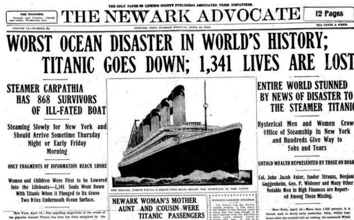
The Newark Advocate , April 16, 1912.