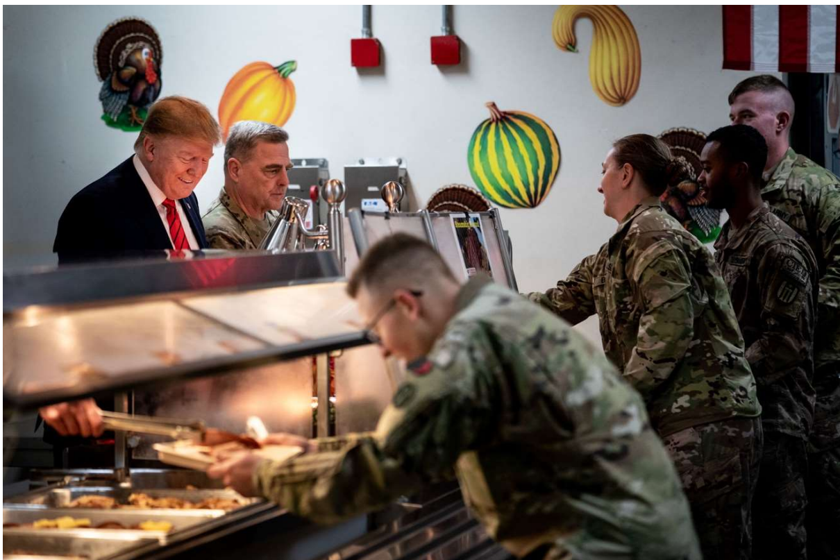
Erin Schaff, “Mr. Trump served food to troops in Afghanistan during the visit to Kabul”, The New York Times , November 2019