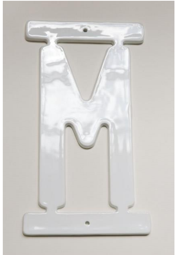
Document 2. Atelier Ter Bekke & Behage, Signalétique directionnelle et muséographique, Limoges, 2014.