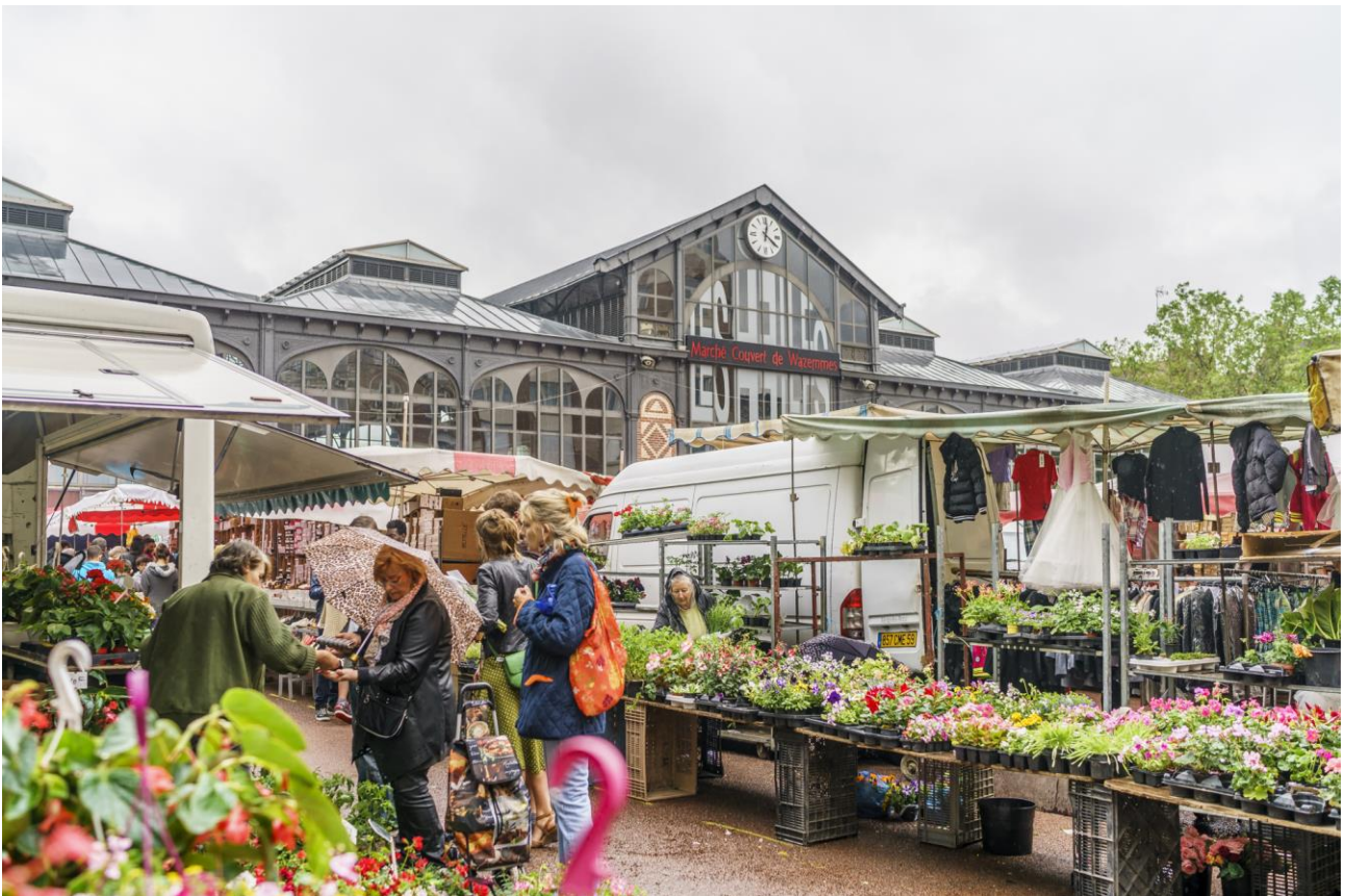
Document 1. Photographies du marché de Wazemmes, Lille