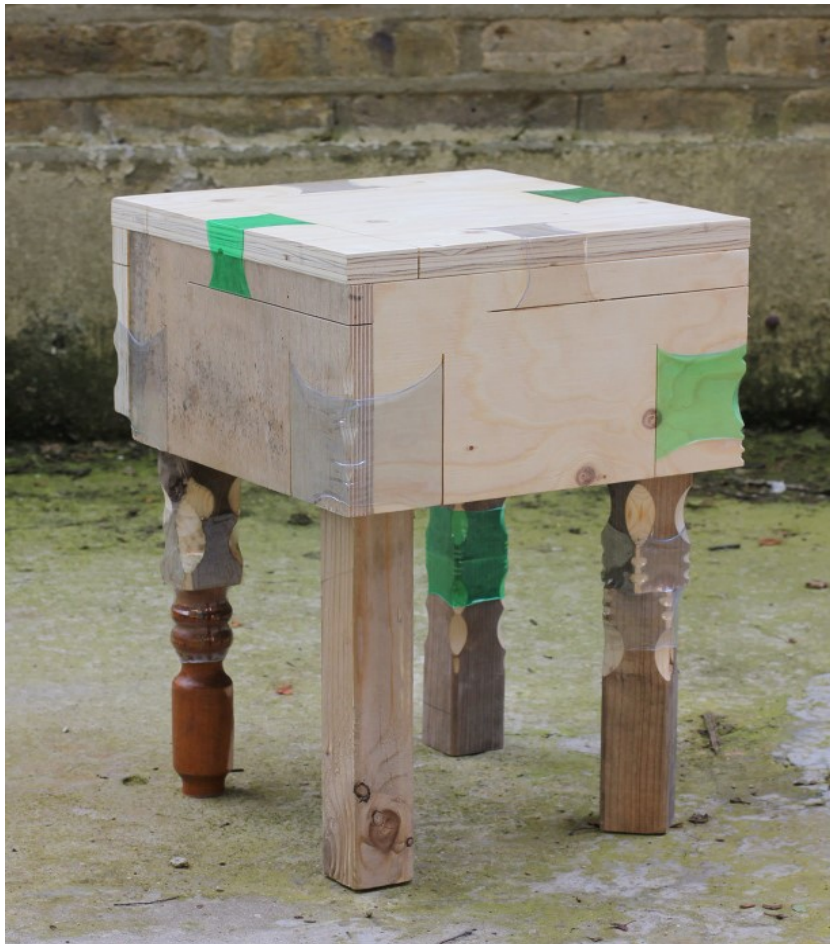
1. Micaella PEDROS , designer, Joining Bottle [proposition de traduction : assembler par des bouteilles], technique expérimentale, Grande-Bretagne, 2017.

Technique expérimentale d'assemblage de bois utilisant des bouteilles en plastique rétréci. Par la chaleur, une simple bouteille en plastique se transforme en un matériau de collage du bois offrant un moyen significatif et accessible de construire des structures fonctionnelles.