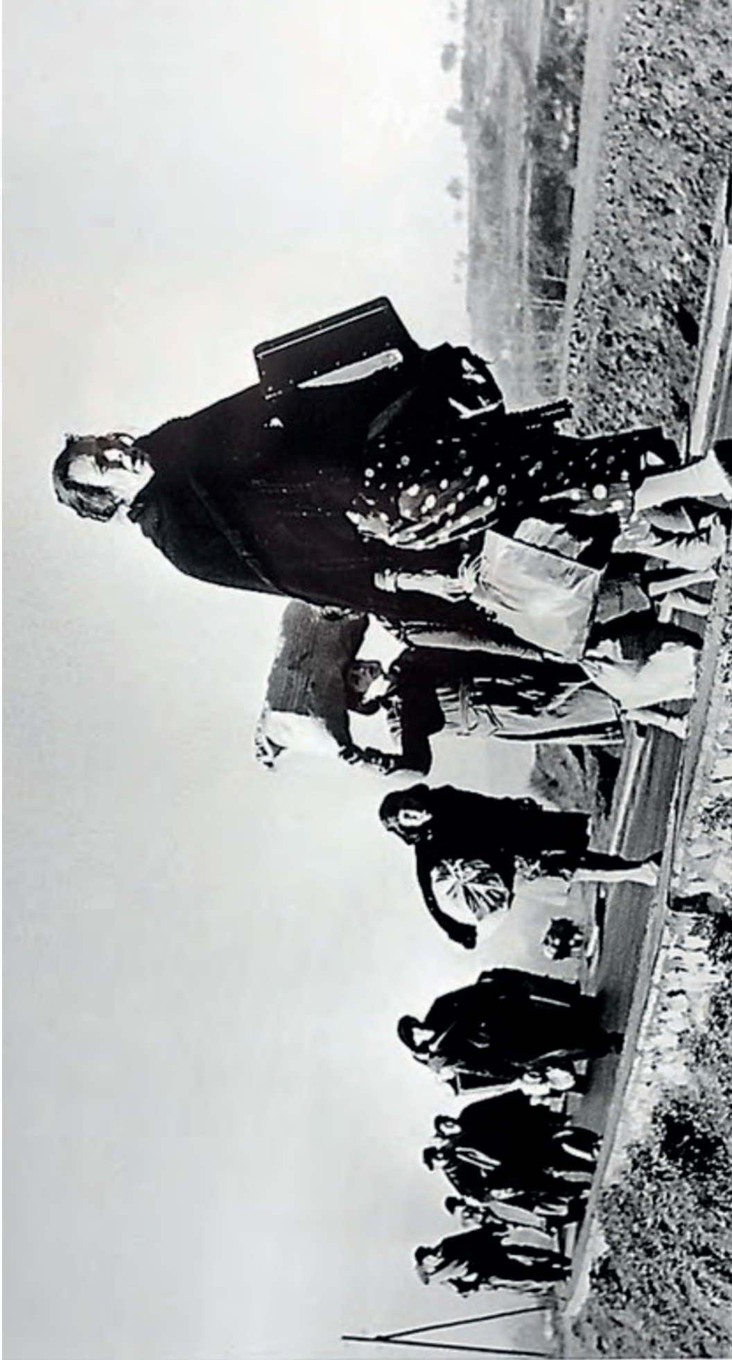
Document 4. Robert Capa, Réfugiés marchant sur la route entre Barcelone et la frontière franco-espagnole , 25-27 janvier 1939. Photographie argentique noir et blanc.