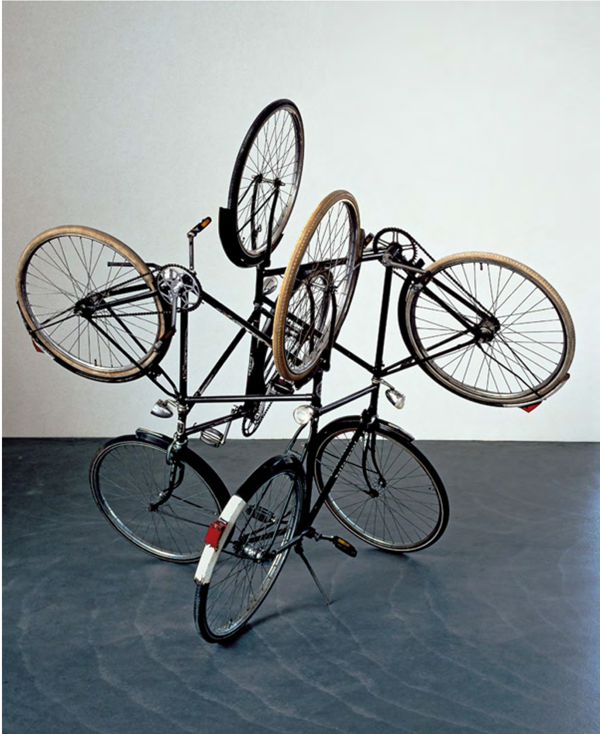
Document 3. Gabriel Orozco, Four bicycles (There is always one direction) [Quatre vélos (il y a toujours une unique direction)], 1994. Quatre vélos soudés entre eux, 198,1 x 224,5 x 223,5 cm, MoMA, New York.