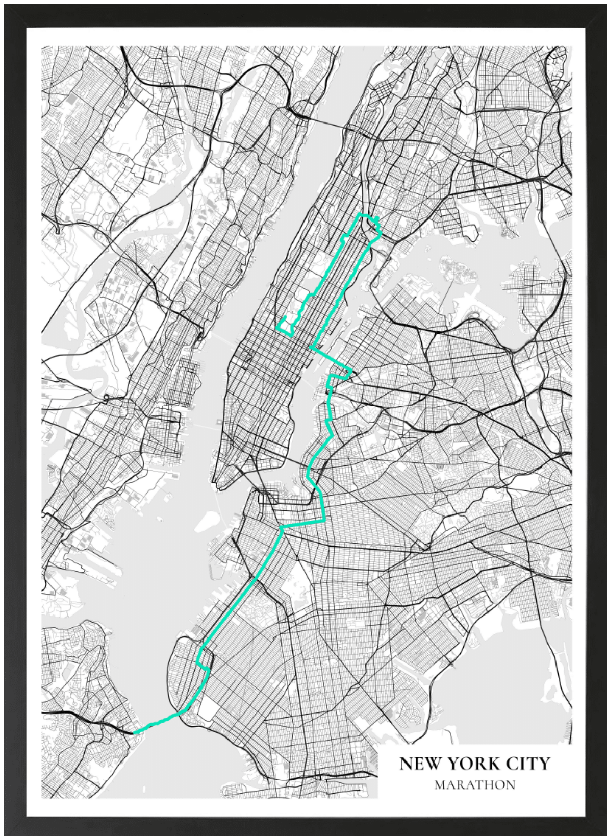
Document 2. Affiche commerciale du tracé GPS montrant le parcours du Marathon de New York sur un plan de Manhattan, 70 x 50 cm.