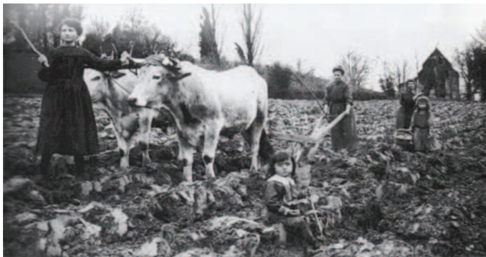
Trabalh agricòla dins lo Gers (Gasconha) durant la primiera guerra mondiala.

1- Quora e onte es prenguda quela fotografia ?