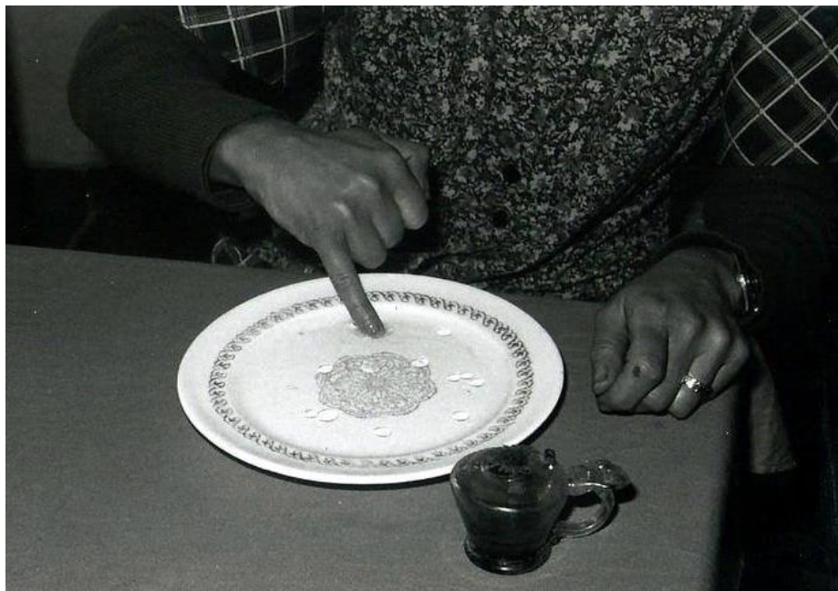
Rituale di l'ochju. (1970). Zalana.