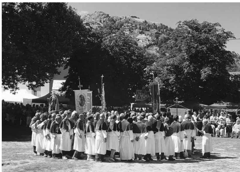
Granitula di a Santa di u Niolu l'8 di settembre di u 2018.