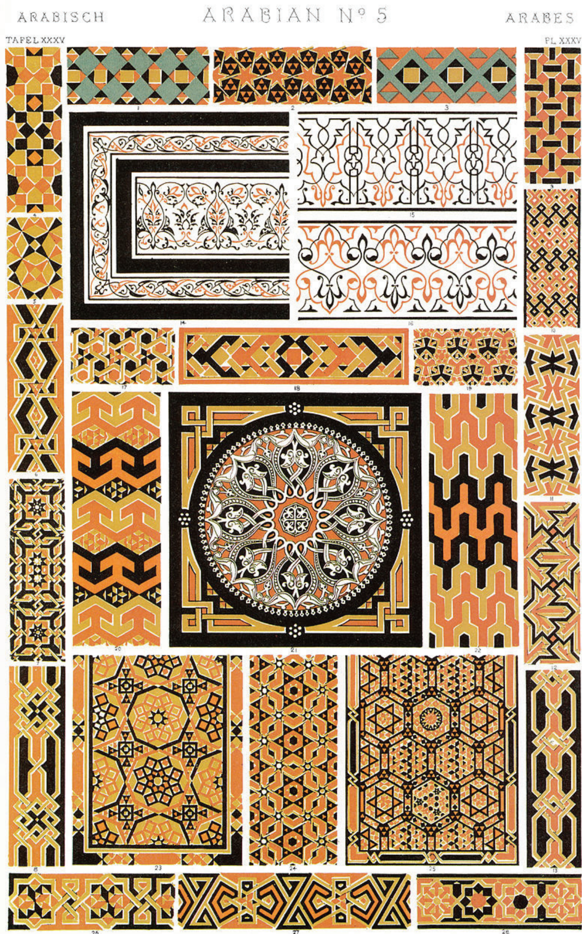
Document 1 : Owen JONES, illustration tirée de Grammaire de l'ornement , 1856.