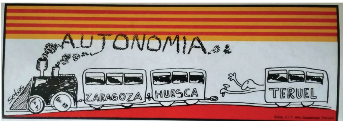
Dibujo publicado en www.teruel existe.info